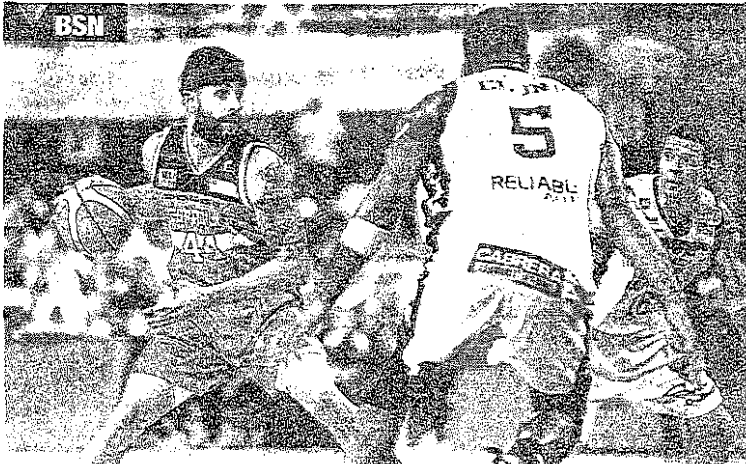
Los Piratas buscarán esta noche en la 'Manuel Petaca' Iguina, de Arecibo, su primer título desde 2013.

so con Maccabi Haifa no afectará su participación con la selección nacional. "Nosotros pudimos negociar eso con el equipo. Este año no voy a tener conflicto", declaró el base agregando que se reportará a Israel el 7 de septiembre. Sobre vestir la camiseta de Puerto Rico comentó que "me siento bien contento, motivado y entusiasmado con esto". "Se siente muy bien. Es un orgullo lo que uno siente", subrayó.