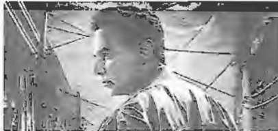
La película puertorriqueña Zack: Enfrentamiento Mortal estrena en cines.