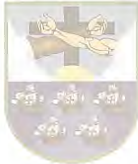
HON. CHRISTIAN E. CORTÉS FELICIANO ALCALDE

APROBADA POR EL ALCALDE DE AGUADA, PUERTO RICO, EL 25 DE julio DE 2021.