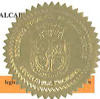
Luis Arroyo Chiqués HON. LUIS ARROYO CHIQUÉS ALCALDE

APROBADA Y FIRMADA POR EL HON. LUIS ARROYO CHIQUÉS ALCALDE DE AGUAS BUENAS, PUERTO RICO, EL 8 DE SEPTIEMBRE DE 2011.