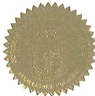
LUÍS ARROYO CHIQUÉS ALCALDE

APROBADA Y FIRMADA POR EL HONORABLE LUÍS ARROYO CHIQUÉS, ALCALDE DE AGUAS BUENAS, PUERTO RICO, EL DÍA 31 DE MAYO DE 2013.