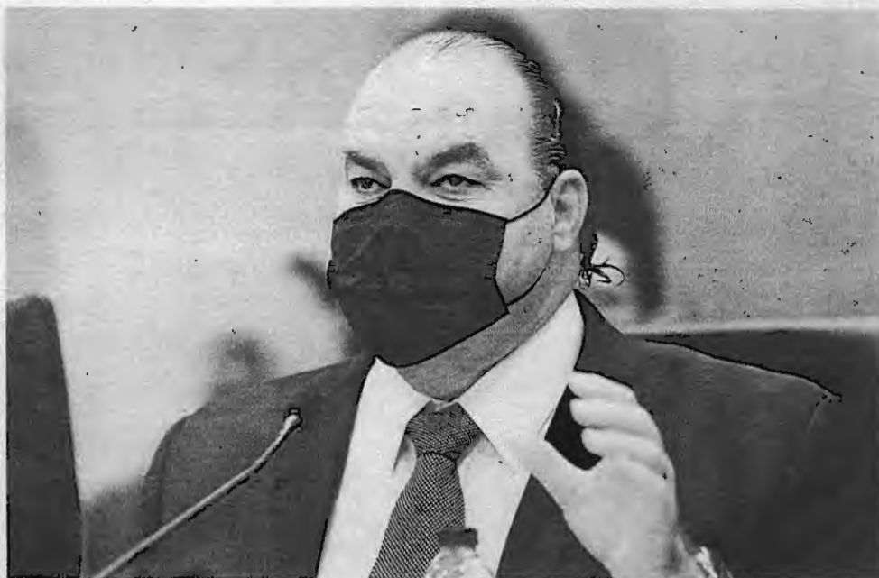
González dijo que el recorte será nefasto para la agricultura.

El titular de Agricultura explicó que la ADEA es la dependencia que se encarga de proveer los subsidios a los agricultores, entre los que figuran el subsidio salarial,