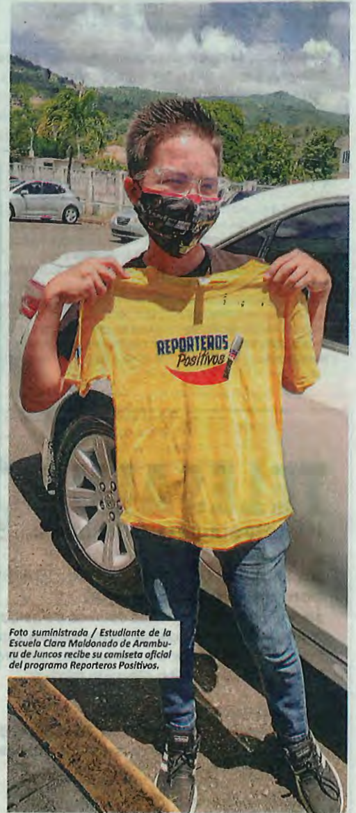
Estudiante de la Escuela Clara Maldonado de Aramburu de Juncos recibe su camiseta oficial del programa Reporteros Positivos.

El programa fortalece las destrezas de liderazgo, compromiso con sus comunidades y manejo correcto del lenguaje dentro de su entorno escolar. A través de seminarios con destacados periodistas de nuestros medios,