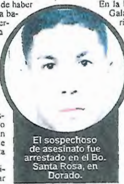
El sospechoso de asesinato fue arrestado en el Bo. Santa Rosa, en Dorado.

Según la investigación del Cuerpo de Investigaciones Criminales de Bayamón, el imputado dio muerte a Colón Morales por éste en un negocio en compañía de su expareja.